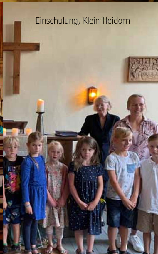
Einschulung, Klein Heidorn