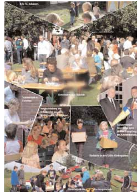
Rückseite der ersten Ausgabe 2008