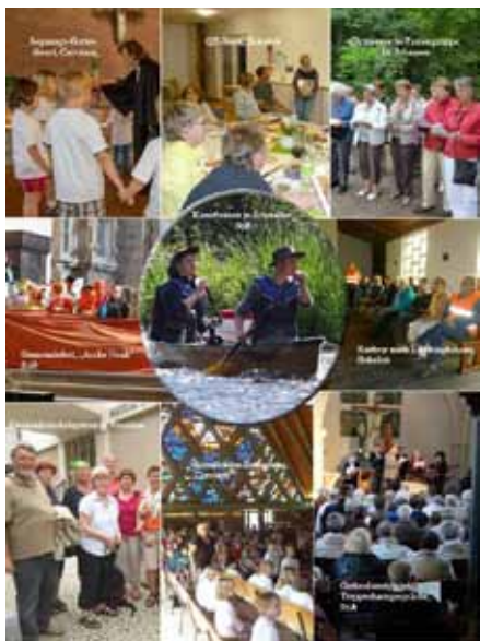
Rückseite der Ausgabe 2013/4