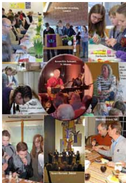
Rückseite der Ausgabe 2016/3

Mit großer Vorfreude schauen wir als Verantwortliche in den Gemeinden auf die Zukunft. Es sieht jetzt schon danach aus, dass der neue Gemeindebrief kreatives Potential freigesetzt hat, so wie der Regenbogen vor 17 Jahren.