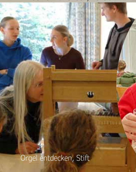
Orgel entdecken, Stift