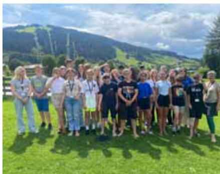
Die KonfirmandInnen in Wagrain

Viele Kirchen im Land laden zu einem Besuch ein. Die Stiftskirche