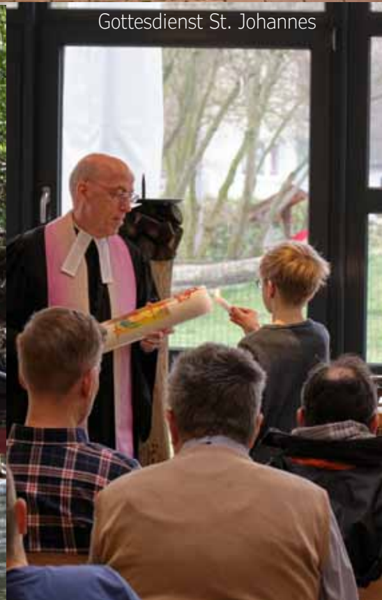
Gottesdienst St. Johannes