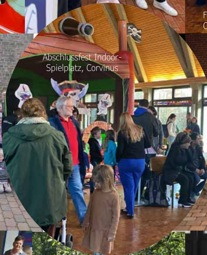
Abschlussfest Indoor-Spielplatz, Corvinus