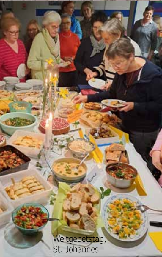
Weltgebetstag, St. Johannes