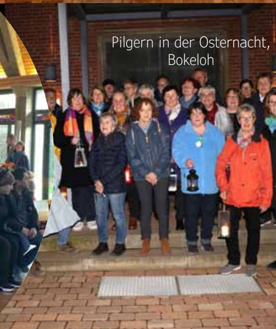
Pilgern in der Osternacht, Bokeloh