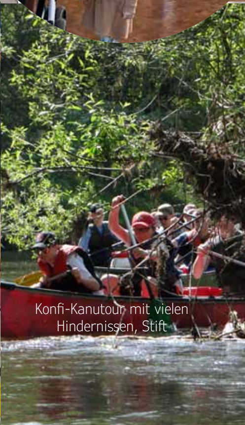
Konfi-Kanutour mit vielen Hindernissen, Stift