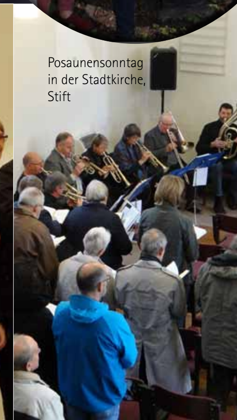
Posaunensonntag in der Stadtkirche, Stift