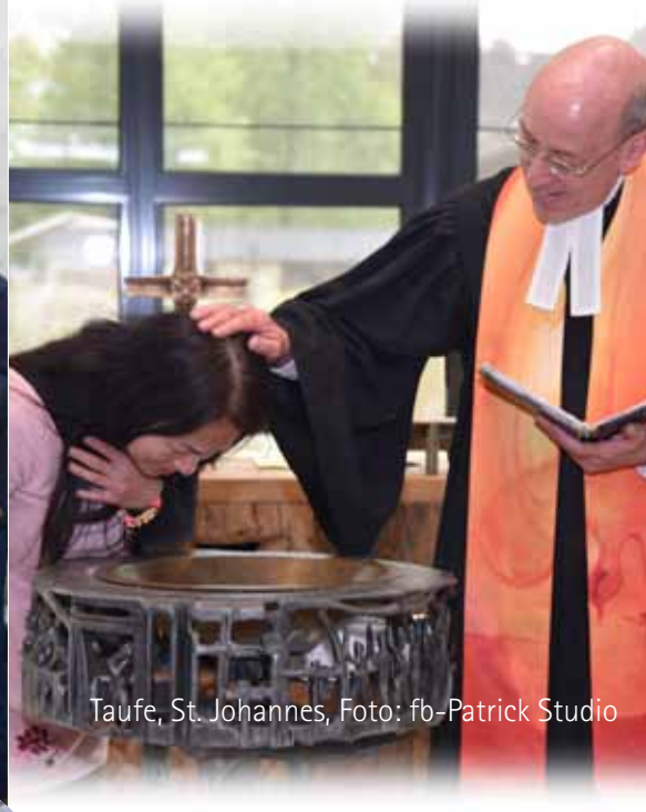
Taufe, St. Johannes, Foto: fb-Patrick Studio