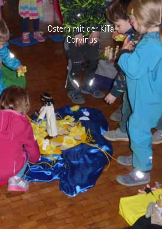
Ostern mit der KiTa, Corvinus