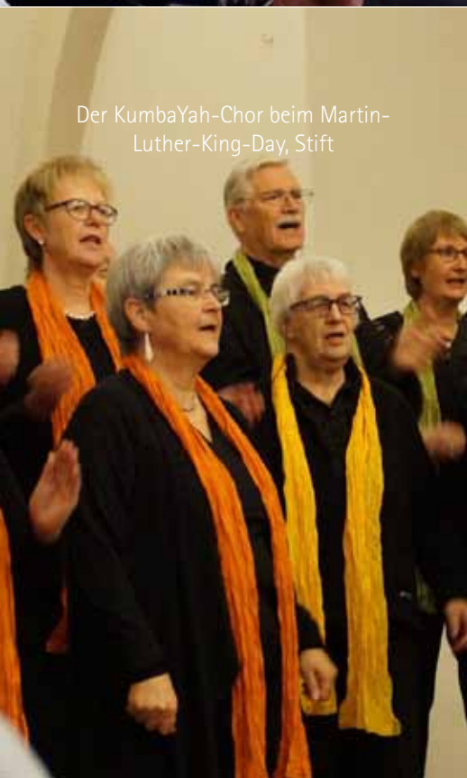
Der KumbaYah-Chor beim Martin-Luther-King-Day, Stift