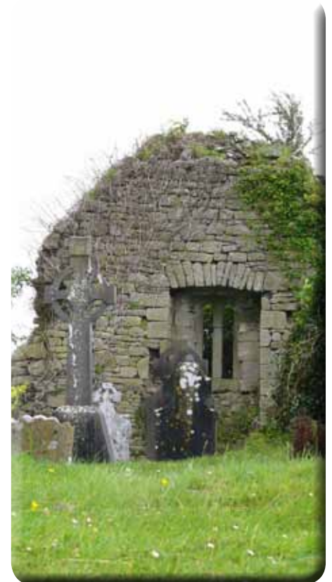
aufgegebene Kirche in Irland