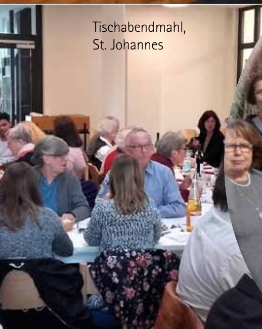
Tischabendmahl, St. Johannes