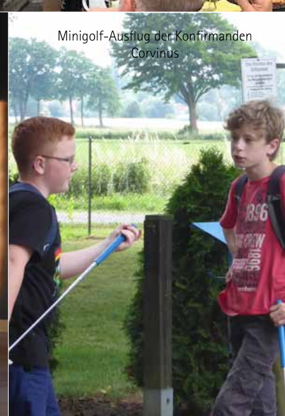
Minigolf-Ausflug der Konfirmanden Corvinus