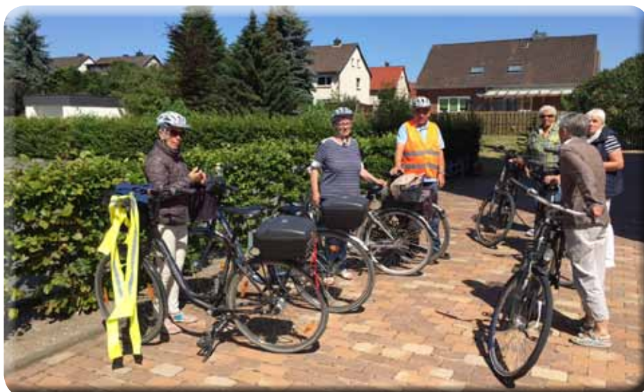
Gottesdienstgruppe beim Start nach Kolenfeld