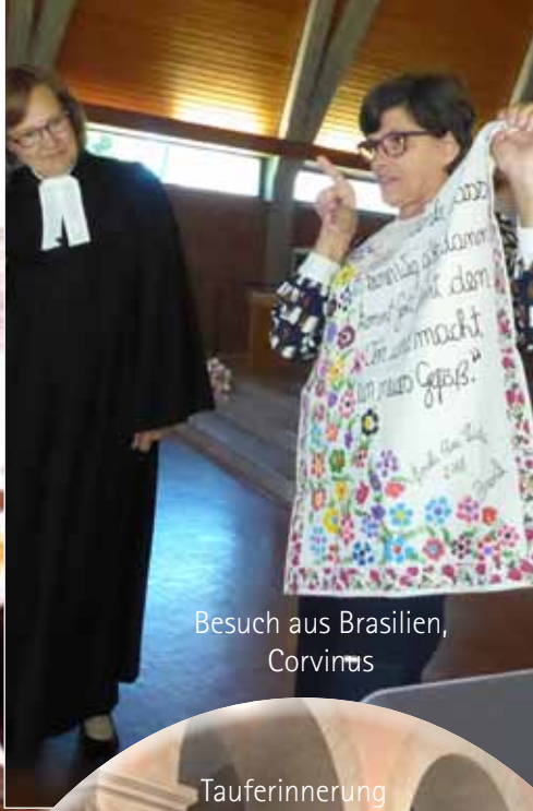
Besuch aus Brasilien, Corvinus