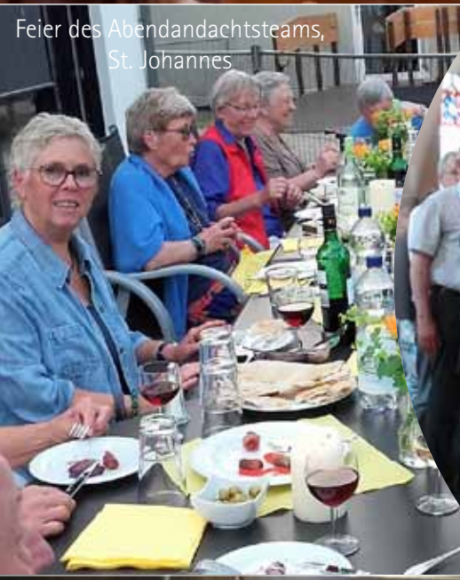
Feier des Abendandachtsteams, St. Johannes