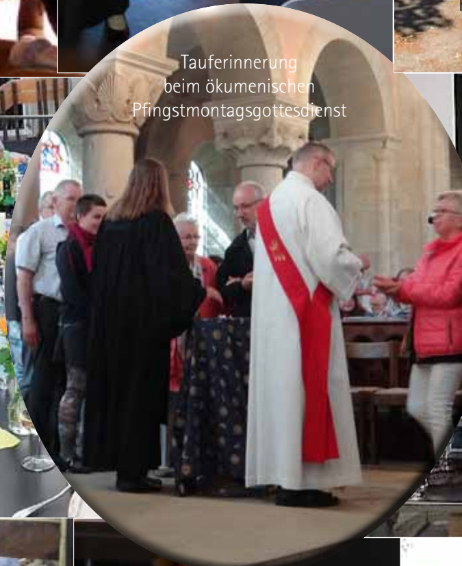
Tauferinnerung beim ökumenischen Pfingstmontagsgottesdienst