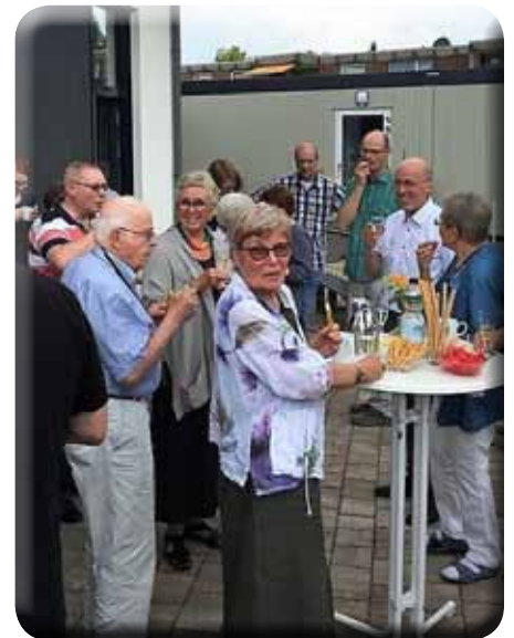
Empfang zur Einführung des neuen Kirchenvorstands