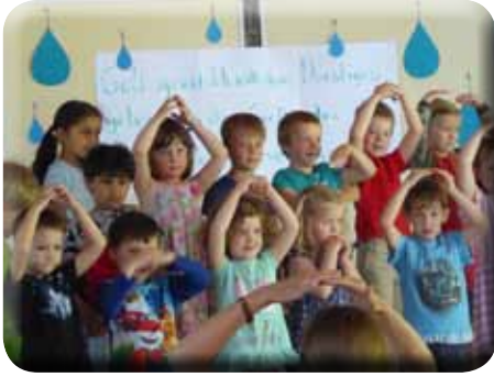
Familiengottesdienst in Covinus