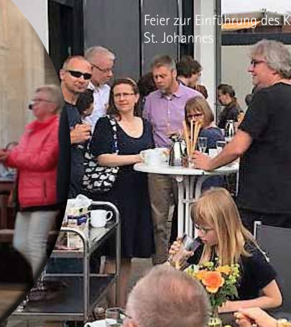
Feier zur Einführung des K St. Johannes