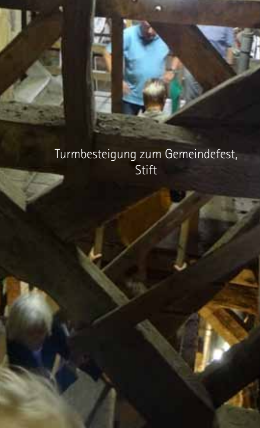
Turmbesteigung zum Gemeindefest, Stift