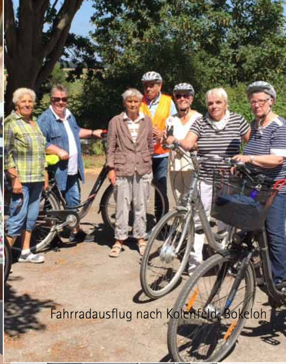
Fahrradausflug nach Kolenfeld, Bokeloh