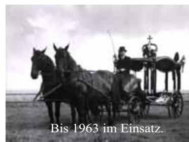
Bis 1963 im Einsatz.

Eine telefonisch Kontaktaufnahme raten wir immer an, da wir berufsbedingt nicht immer im Büro sind.