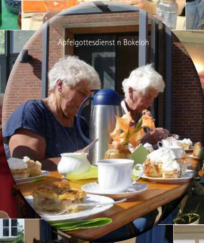
Apfelgottesdienst n Bokeloh