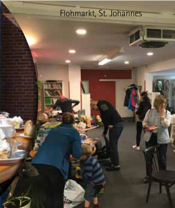
Flohmarkt, St. Johannes