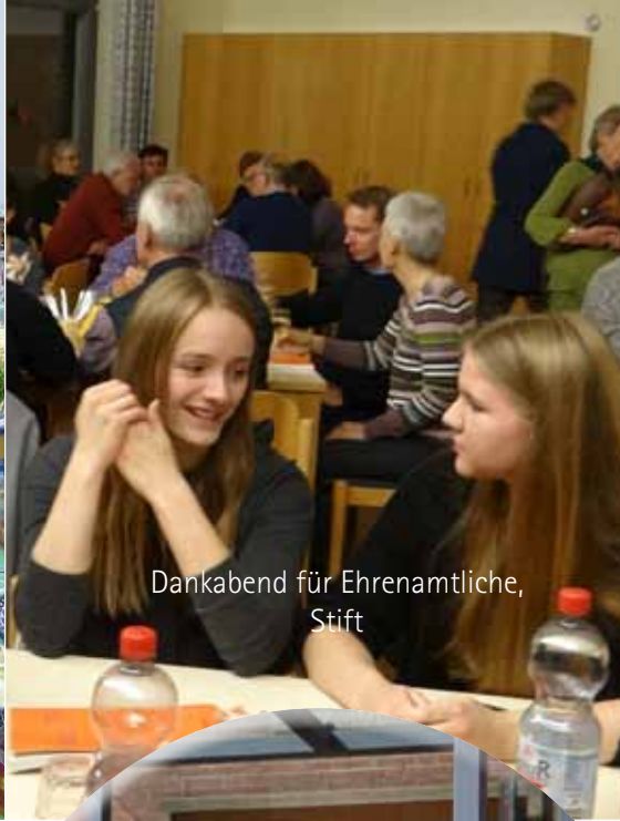
Dankabend für Ehrenamtliche, Stift