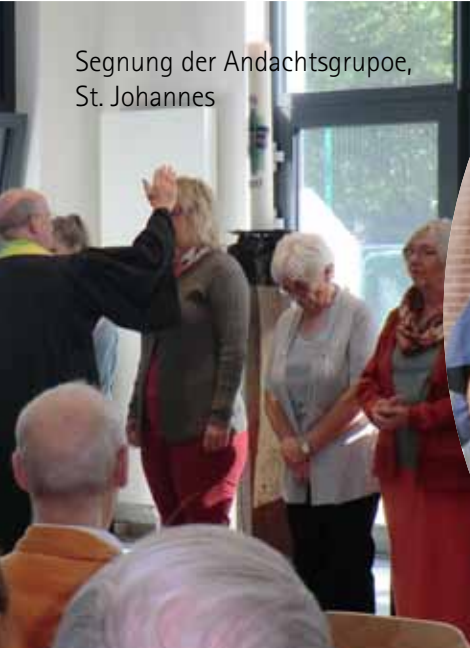
Segnung der Andachtsgruppe, St. Johannes