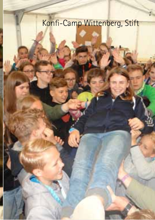
Konfi-Camp Wittenberg, Stift