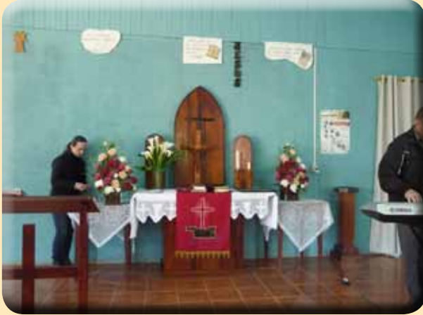
Kirche in ländlicher Region

stützung der Gemeindeglieder und im selbstver-