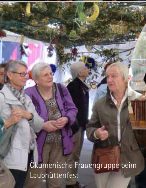
Ökumenische Frauengruppe beim Laubhüttenfest