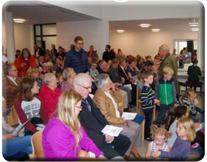
Gottesdienst zur Einweihung des Altars