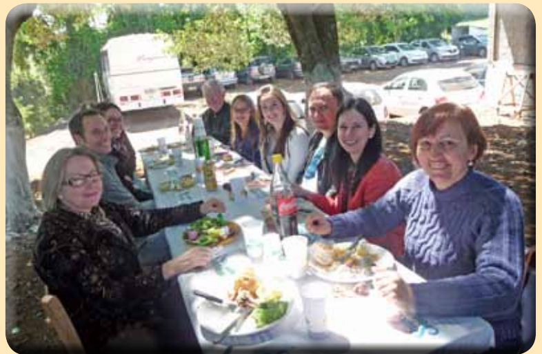
Nach dem Gottesdienst: