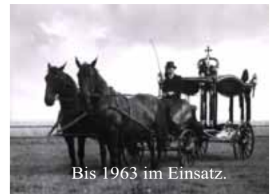
Bis 1963 im Einsatz.