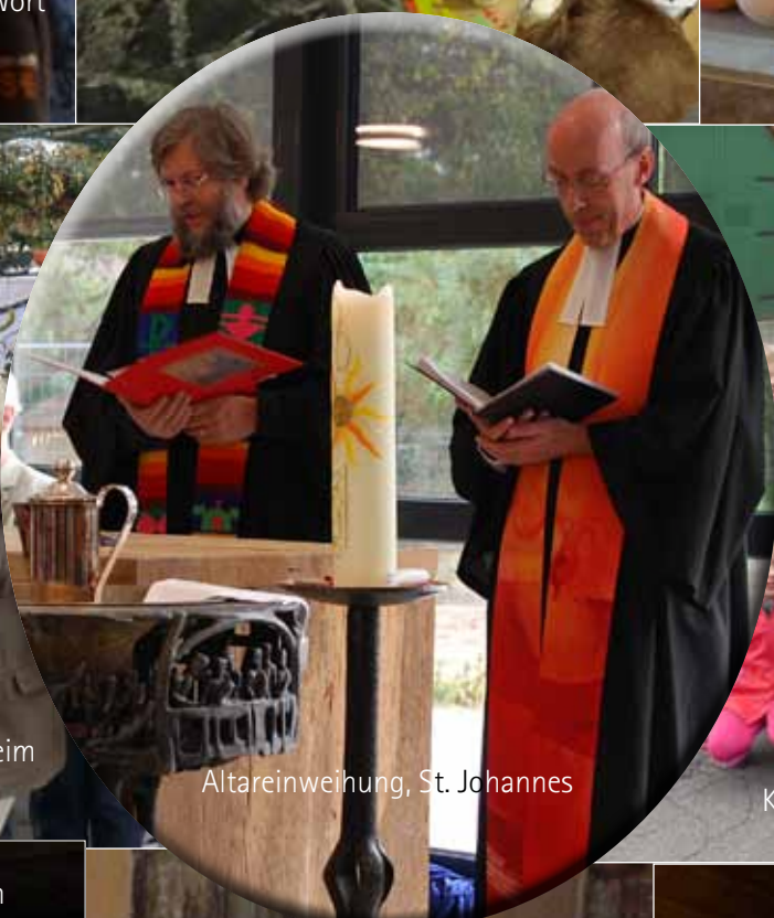
Altareinweihung, St. Johannes