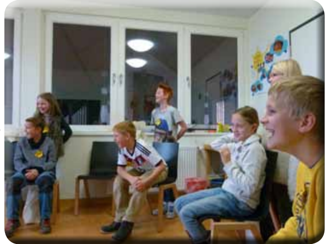
Kinderbibeltage 07. November

In der Regel finden Sie in der Regel sind die Kirchentüren montags und freitags von 15:00 bis 18:00, donnerstags von 10:00 bis 12:00 dazu geöffnet. Treten Sie ein, um einen Moment inne zu halten, Ihre Gedanken schweifen zu lassen, ein Gebet zu sprechen, oder eine Kerze anzuzünden.