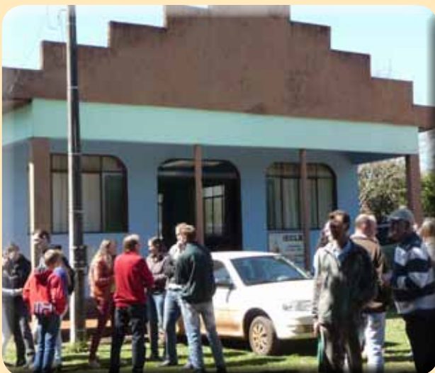
Treffen vor der Kirche

Es gibt eine lebendige Partnerschaft mit Brasilien in unserem Kirchenkreis. Jetzt waren außerdem 17 Pastorinnen und Pastoren aus der gesamten Landeskirche zu einem Partnerschaftsbesuch in Brasilien. In Begegnungen vor Ort konnten wir eine selbstbewusste kirchliche Minderheit im multireligiösen Kontext erleben, die ihren Glauben stolz und optimistisch lebt. Den lutherischen Gemeinden in Brasilien ist die religiöse Bildung wichtig, das Feiern von Gottesdiensten und das gesellige Miteinander. Wir konnten dort neu erleben und sehen, was wir in unserer nordeuropäischen Zivilisation schon fast verlernt und verloren haben: das Leben in Gemeinschaft, angewandte Diakonie in der gegenseitigen Unter-