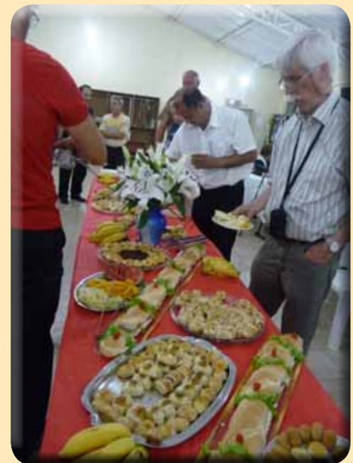
Buffet am Mittwochabend nach der Andacht

Der Partnerschaftsaustausch hilft, die eigenen evangelischen Wurzeln wiederzufinden. Hierzu gibt es ein breites Netzwerk in unserem Kirchenkreis, das weiter unterstützt werden soll.