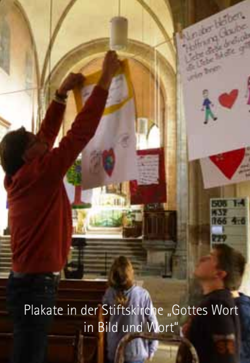
Plakate in der Stiftskirche „Gottes Wort in Bild und Wort“