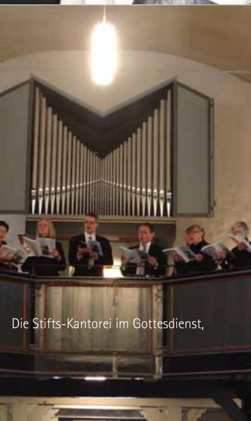
Die Stifts-Kantorei im Gottesdienst,