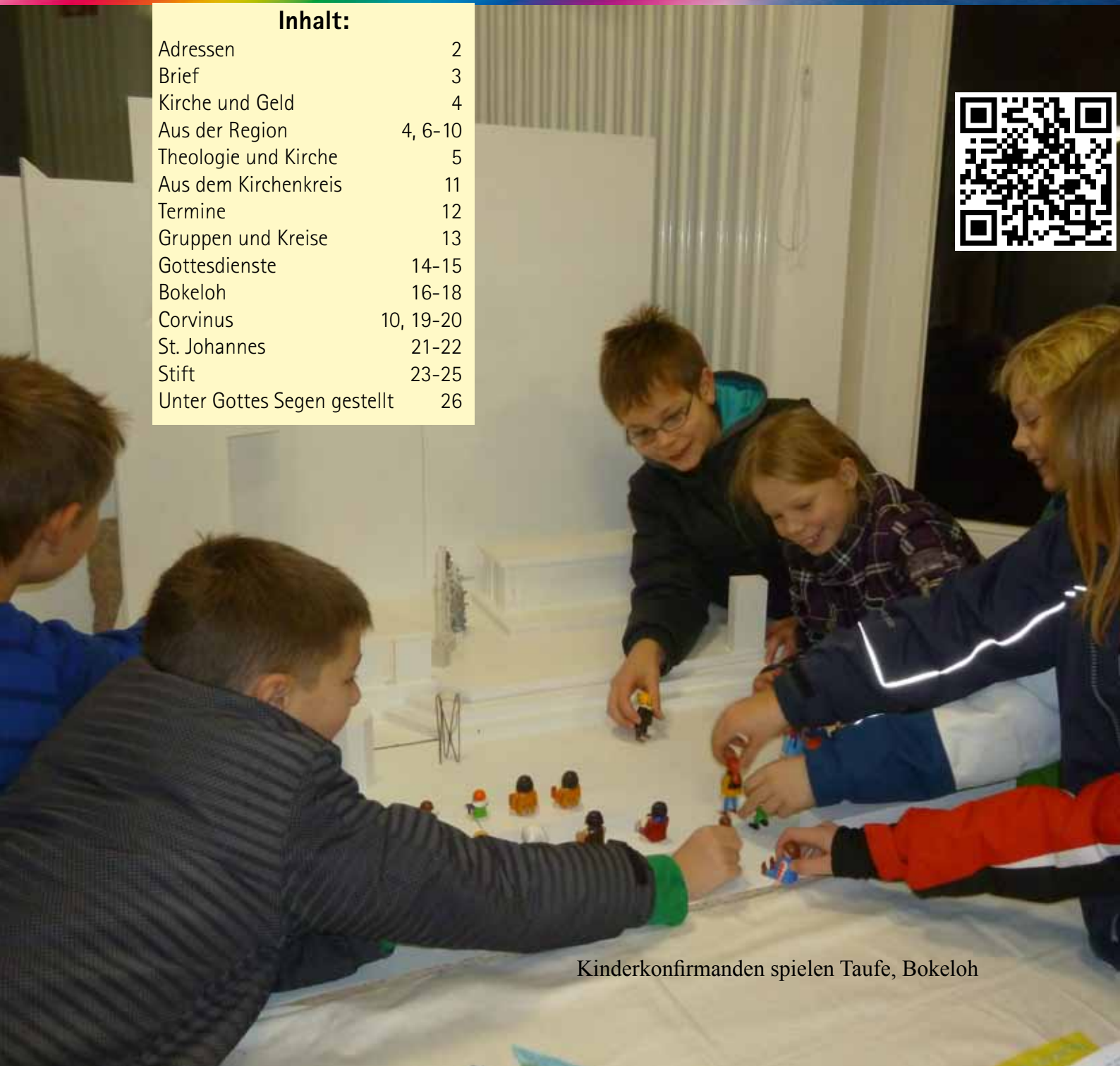
Kinderkonfirmanden spielen Taufe, Bokeloh