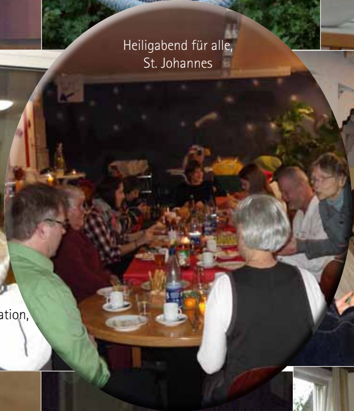
Heiligabend für alle, St. Johannes