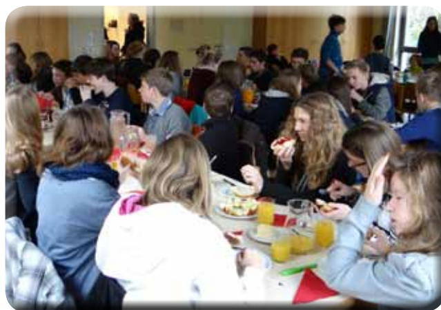
Die Sonntagskonfirmanden beim Frühstück