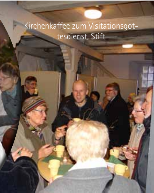
Kirchenkaffee zum Visitationsgottesdienst, Stift