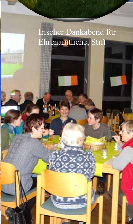
Irischer Dankabend für Ehrenamtliche, Stift