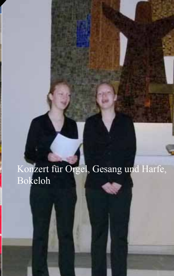
Konzert für Orgel, Gesang und Harfe, Bokeloh