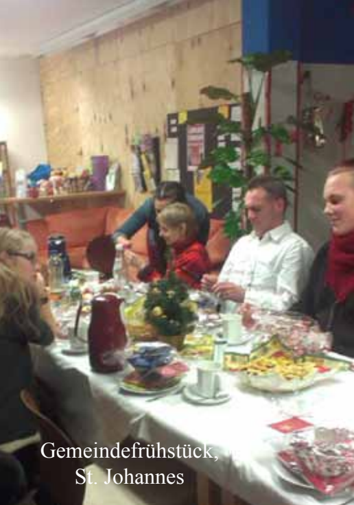
Gemeindefrühstück, St. Johannes