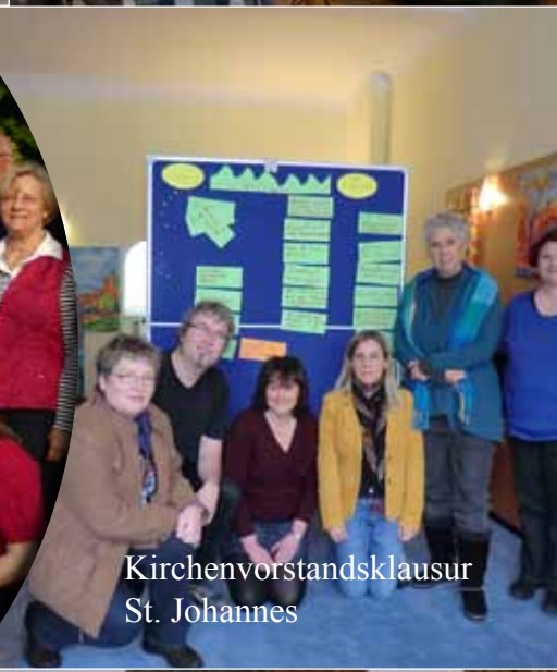
Kirchenvorstandsklausur St. Johannes