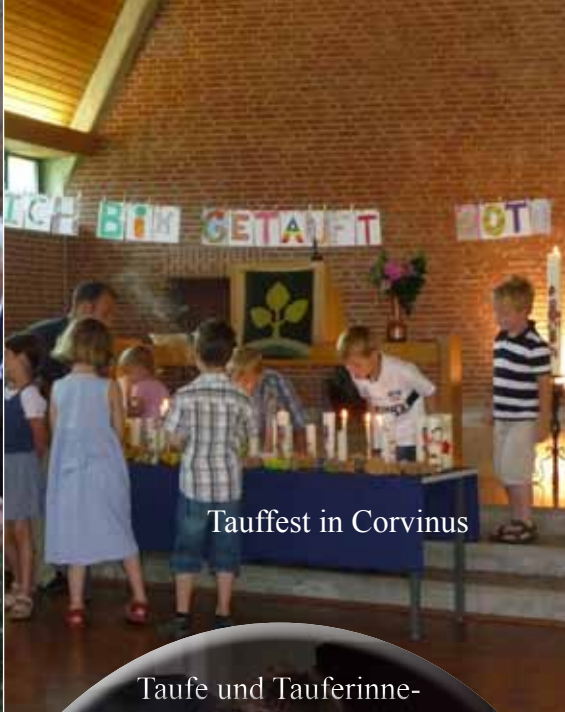
Taufest in Corvinus