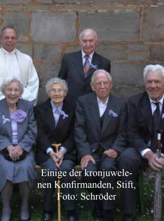
Einige der kronjuwele- nen Konfirmanden, Stift, Foto: Schröder