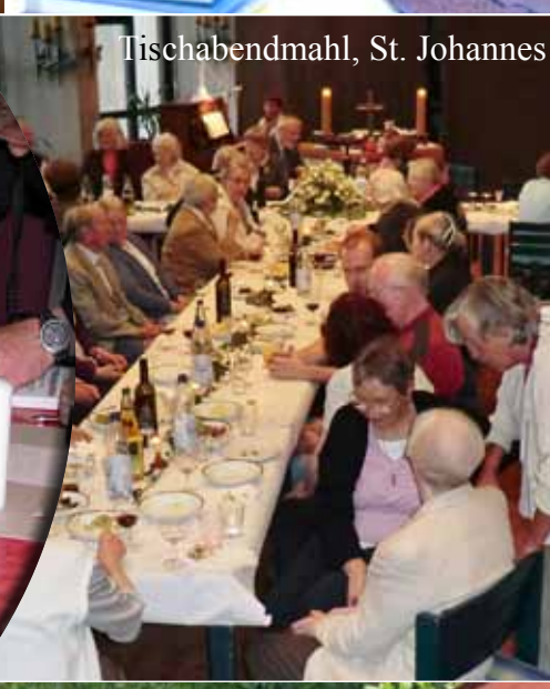
Tischabendmahl, St. Johannes