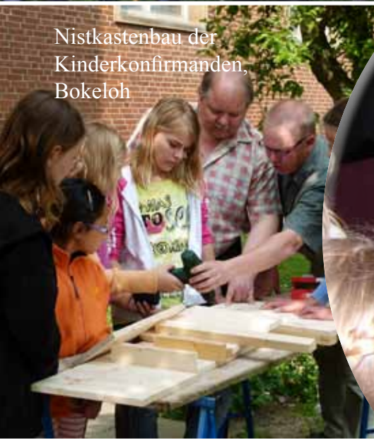
Nistkastenbau der Kinderkonfirmanden, Bokeloh