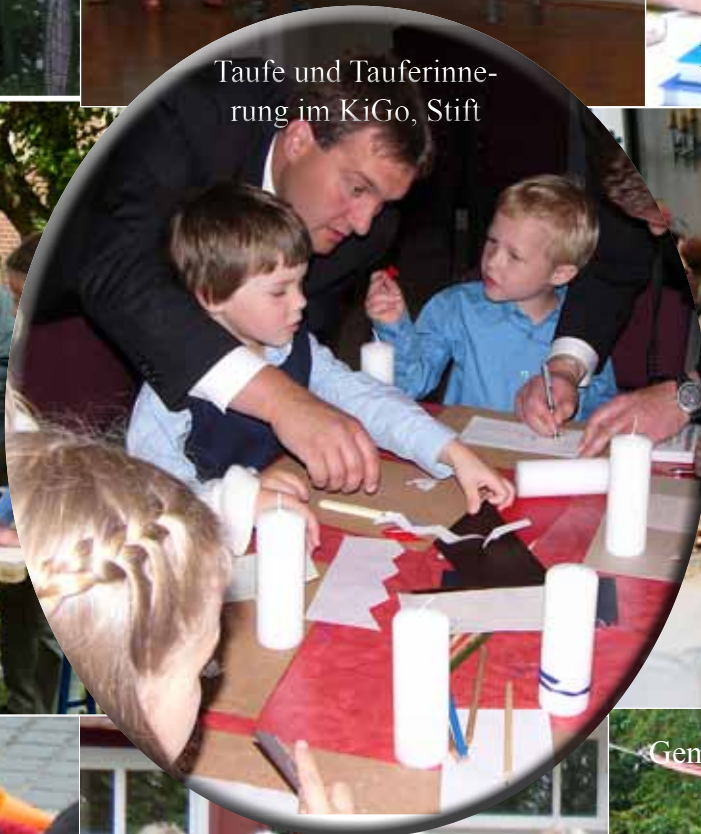
Taufe und Taufferinne- rung im KiGo, Stift