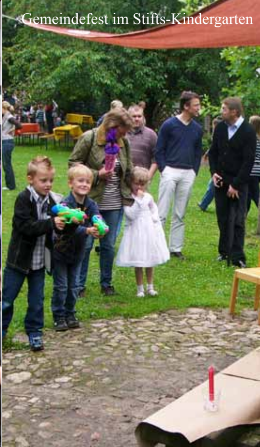
Gemeindefest im Stifts-Kindergarten