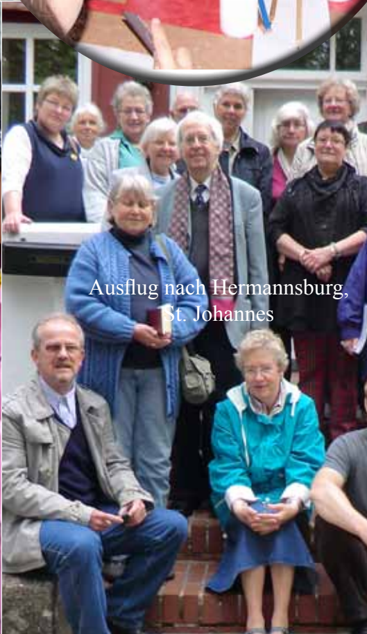
Ausflug nach Hermannsburg, St. Johannes