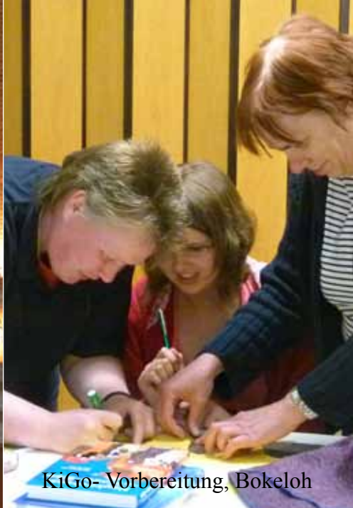
KiGo- Vorbereitung, Bokeloh