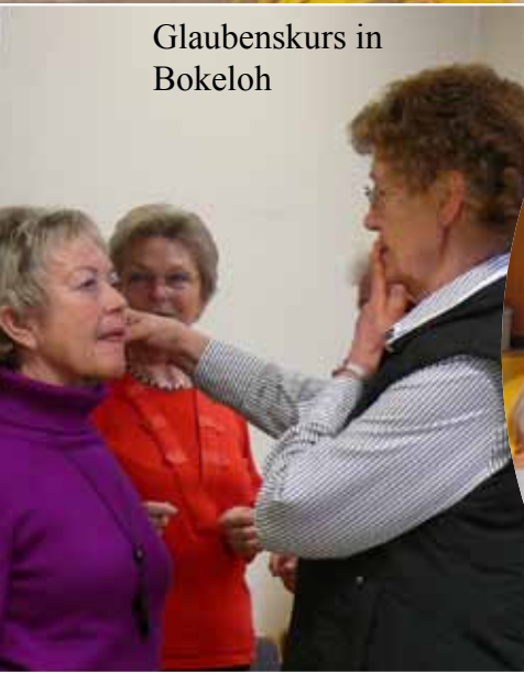
Glaubenskurs in Bokeloh