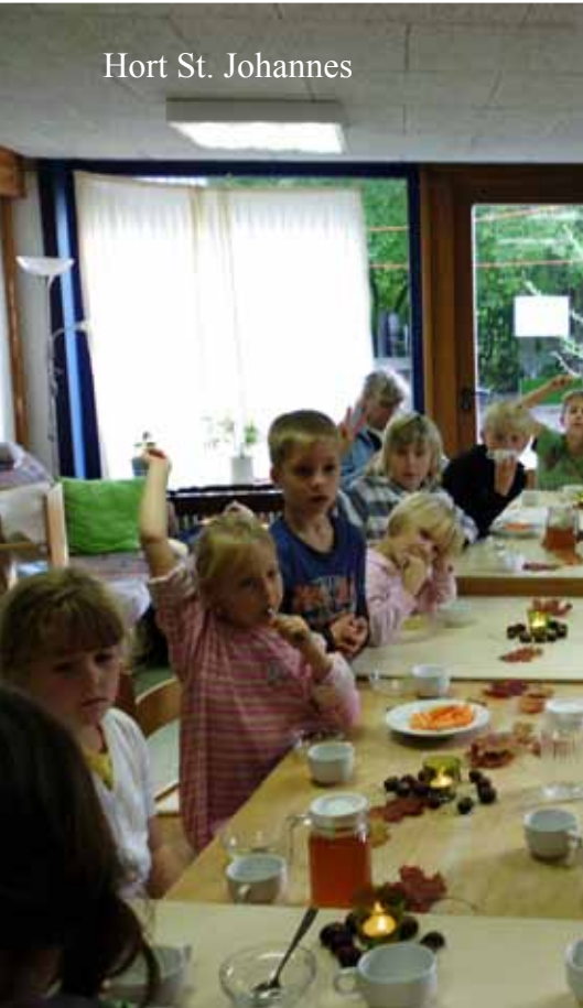
Hort St. Johannes