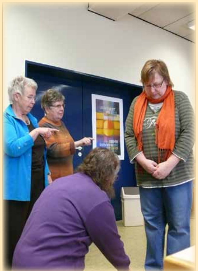
Rollenspiel beim Glaubenskurs in Bokeloh: Jesus und die Ehebrecherin