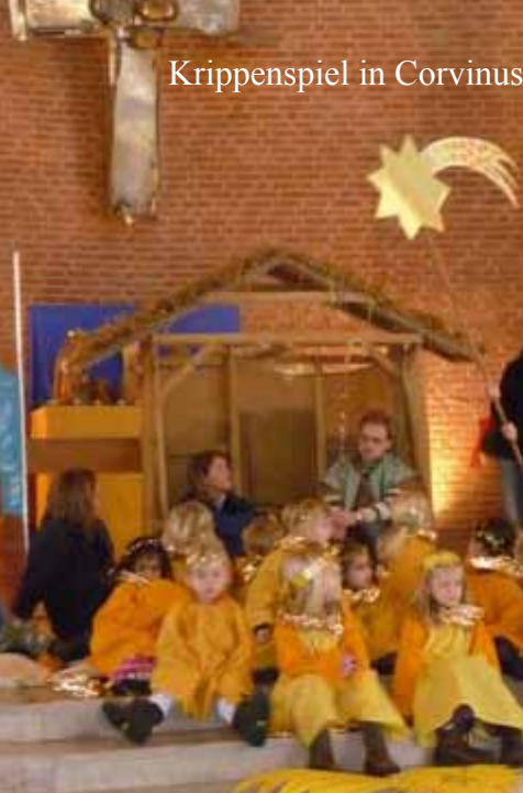
Krippenspiel in Corvinus