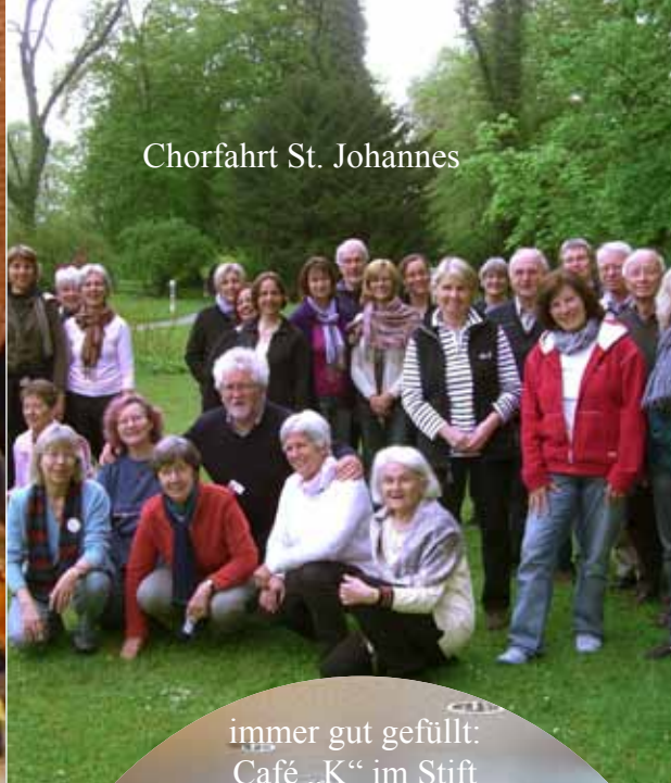
Chorfahrt St. Johannes