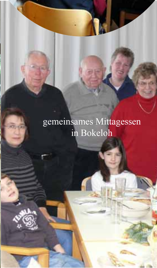
gemeinsames Mittagessen in Bokeloh