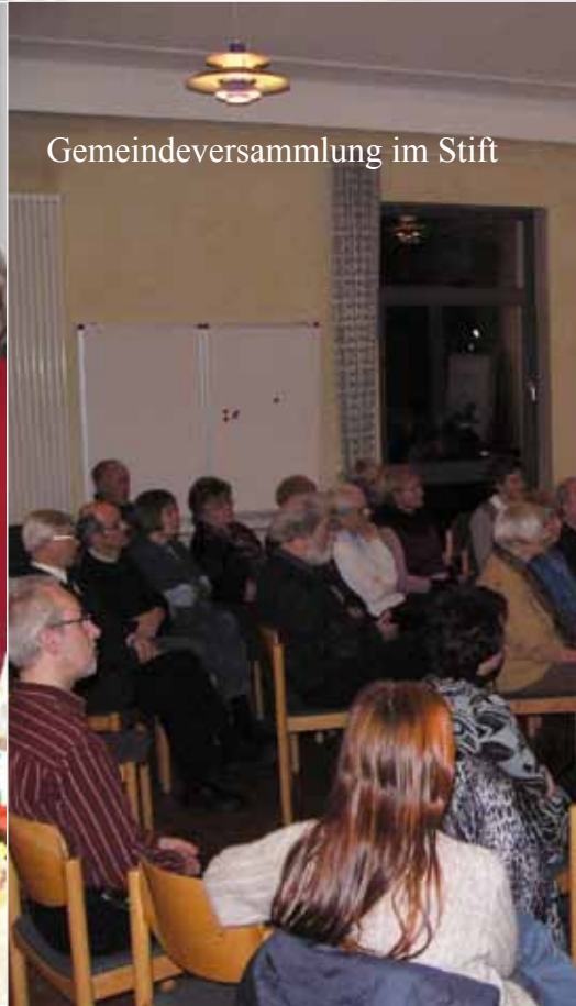
Gemeindeversammlung im Stift