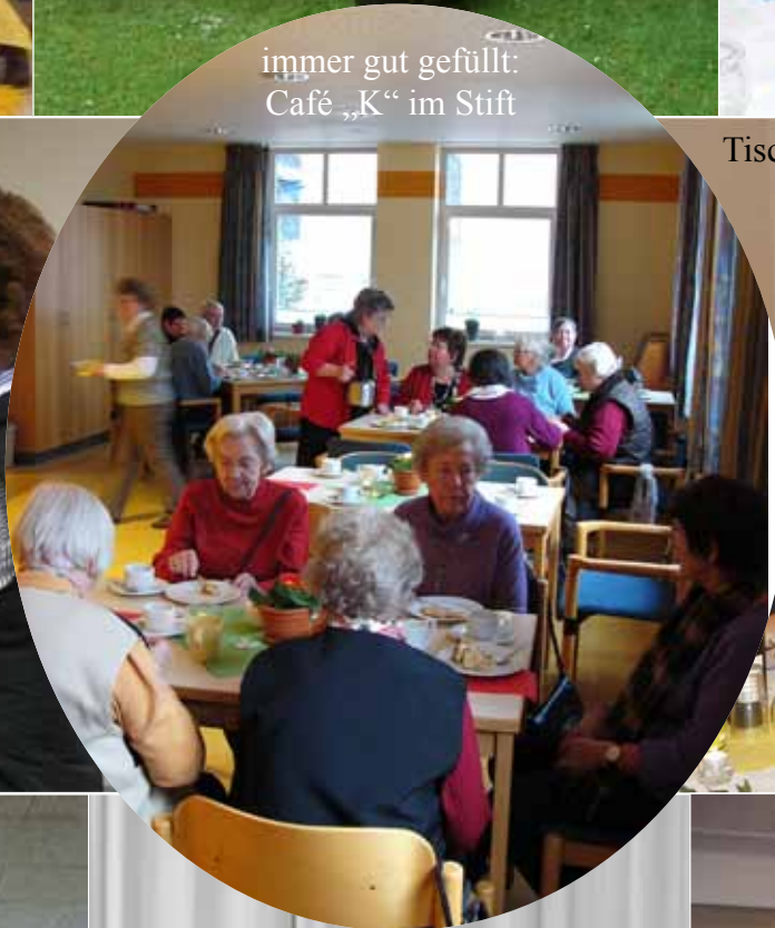
immer gut gefüllt: Café „K“ im Stift