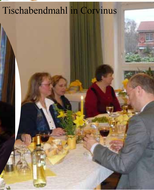
Tischabendmahl in Corvinus