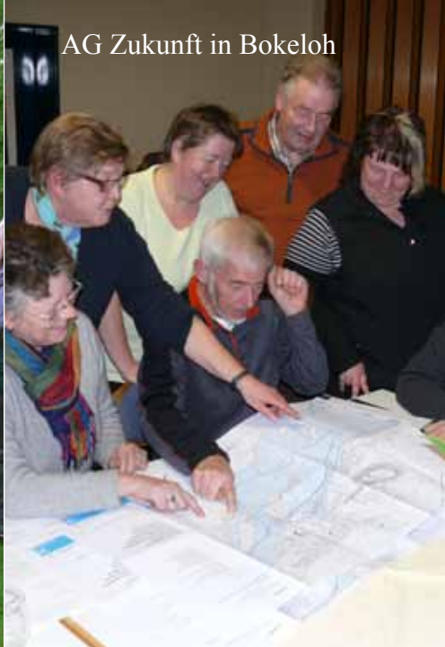
AG Zukunft in Bokeloh