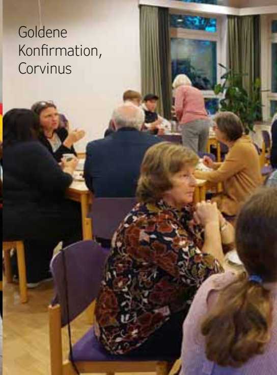
Goldene Konfirmation, Corvinus