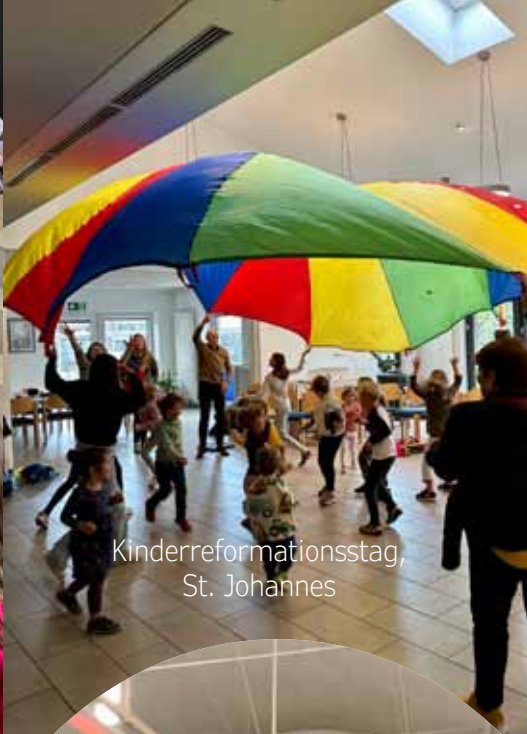
Kinderreformationsstag, St. Johannes