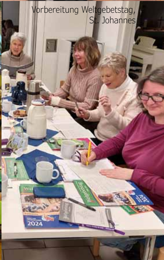
Vorbereitung Weltgebetstag, St. Johannes