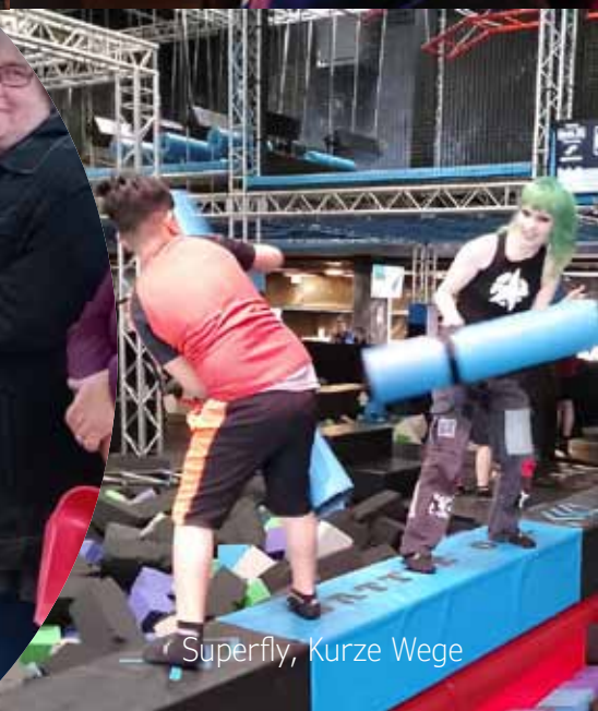
Superfly, Kurze Wege