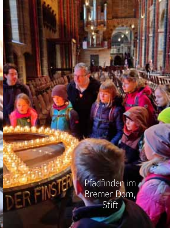
Pfadfinder im Bremer Dom, Stift