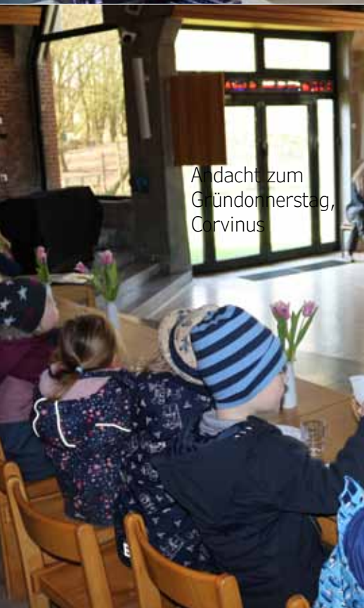
Andacht zum Gründonnerstag, Corvinus