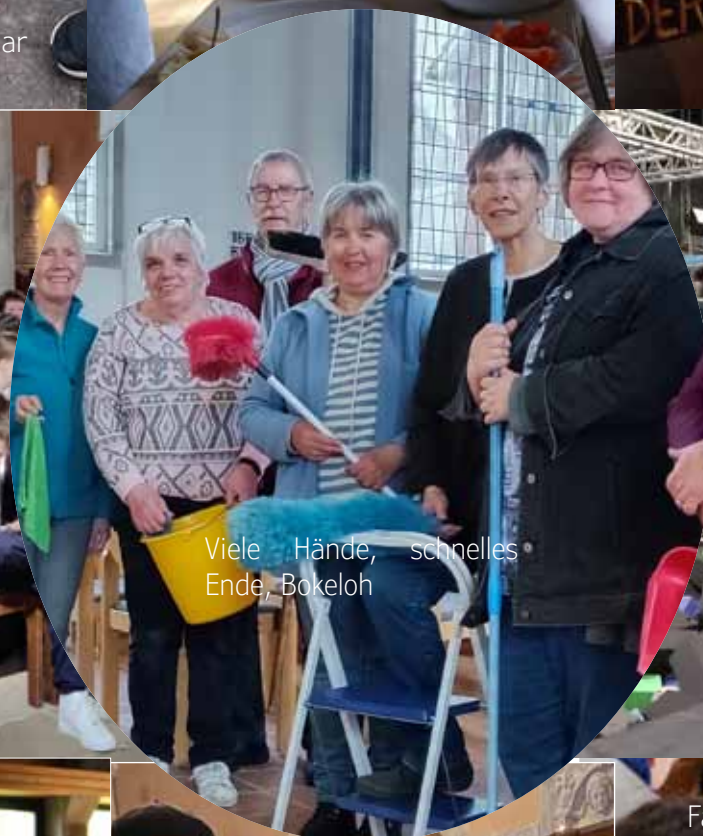
Viele Hände, schnelles Ende, Bokeloh