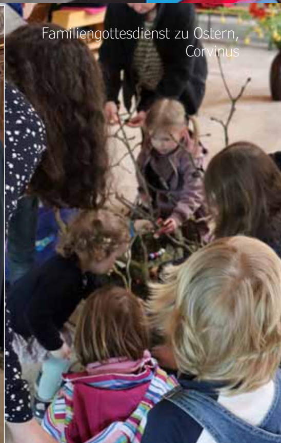
Familiengottesdienst zu Ostern, Corvinus