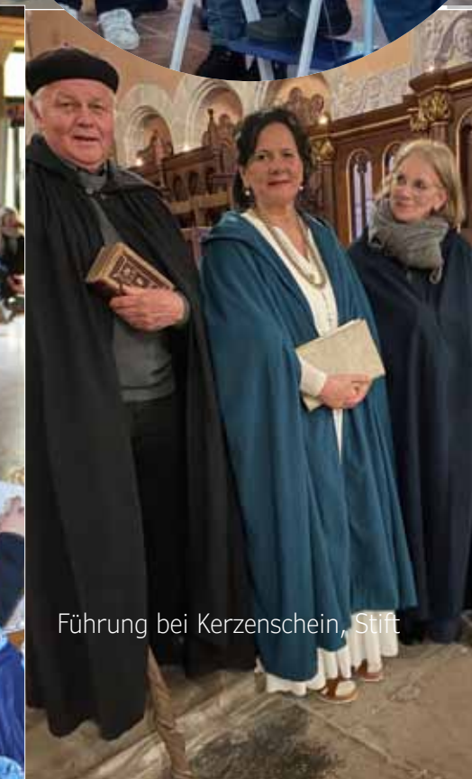
Führung bei Kerzenschein, Stift